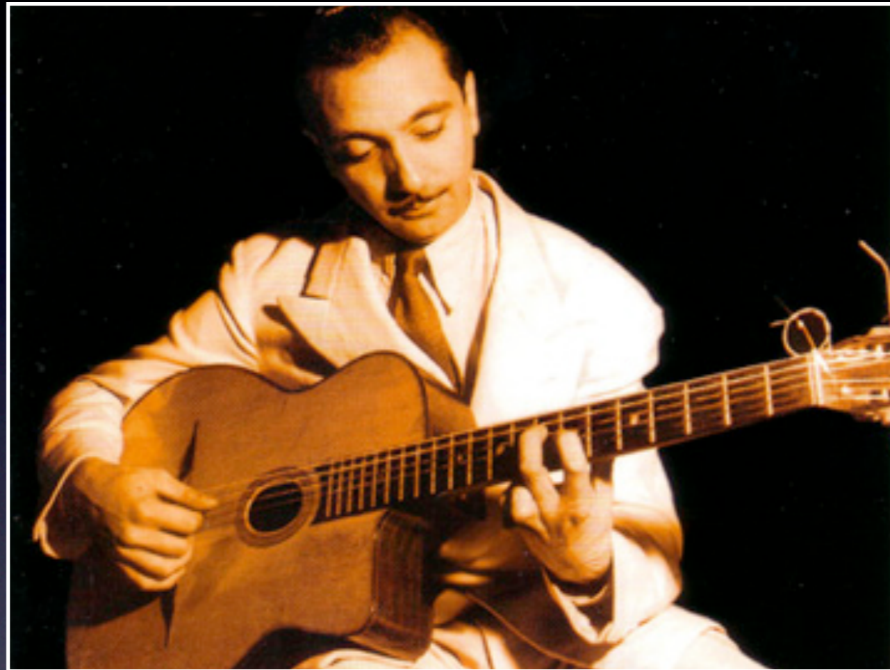
Jean "Django" Reinhardt 23.1.1910 - 16.5.1953